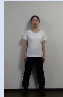
座ってもできますよ♪