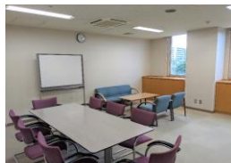
2F 多目的ホール控室