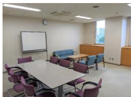
2F 多目的ホール控室